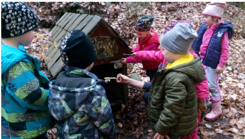
Otvírání studánky, 22.3.2019