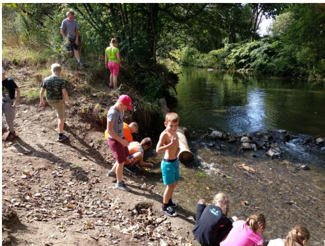
Září 2018 tady jsme u vody.....