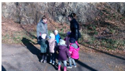
praktikanti z Německa na vycházce s našimi dětmi, projekt Erasmus