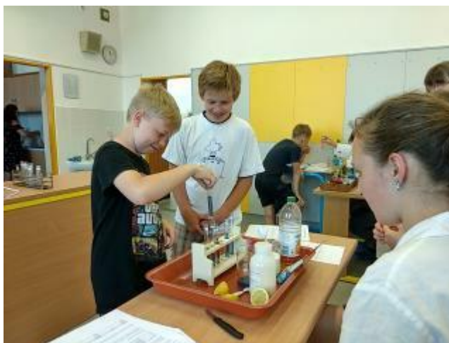
Spolupráce s gymnáziem Zábřeh- zaměřené na cizí jazyky a vědu