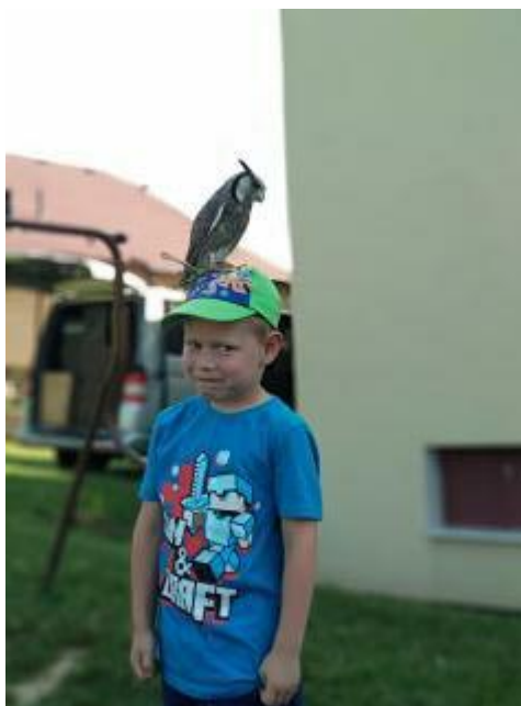
Draví ptáci v naší škole