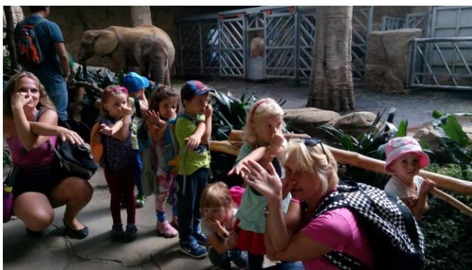
výlet zoo Lešná, září 2018