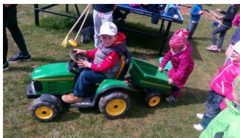
Brigáda na školní zahradě, 7.5.2019