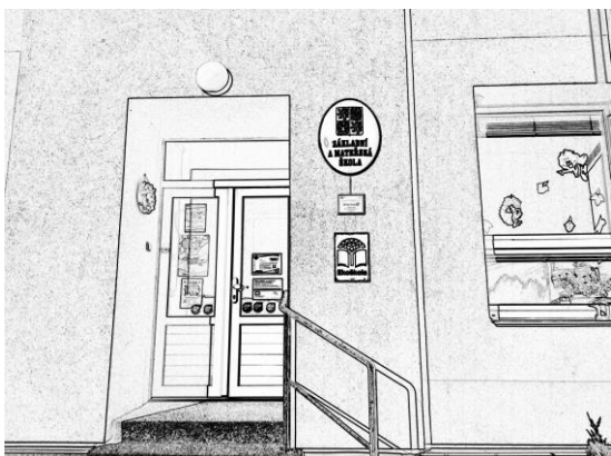
Vstupní dveře ZŠ a MŠ Nemile - ocenění Ekoškola, ocenění Etická škola