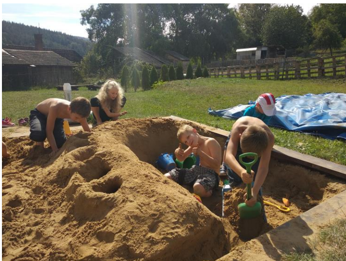
Stavíme na našem pískovišti