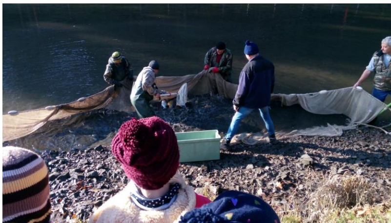
výlov rybníka v Hoštejně, 16.11.2018