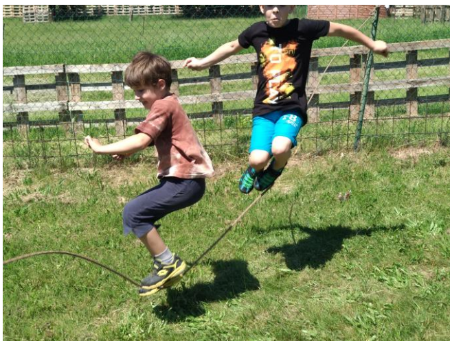
XIII. Nemilská olympiáda