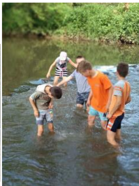
a zase u vody, vlastně ve vodě - červen 2019a