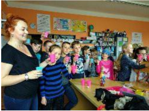
oslava vítězství 1. místa v soutěži Hlídek mladých