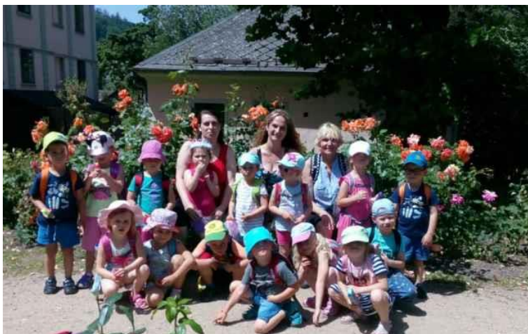
Výlet do Potštejna, 11.6.2019