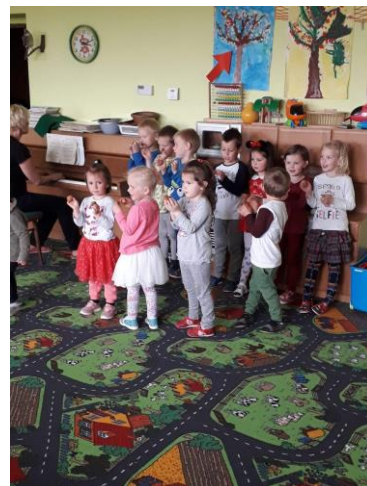
Den rodiny, oslava Dne matek 13.5.2019