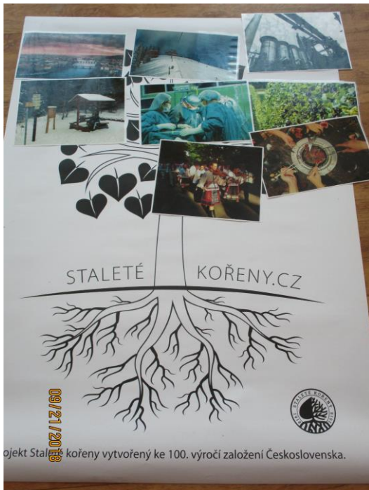
projekt Staleté kořeny vytvořený ke 100. výročí založení Československa.