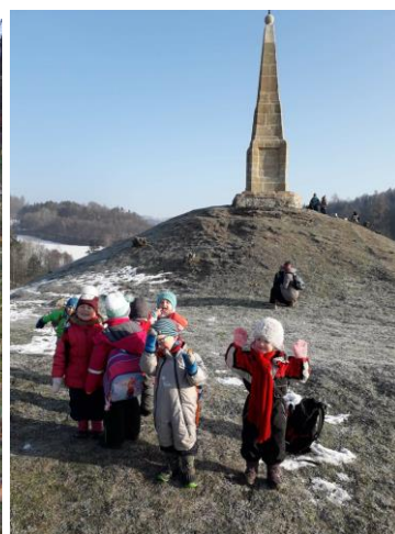
Hoštejn, mohyla, leden 2019